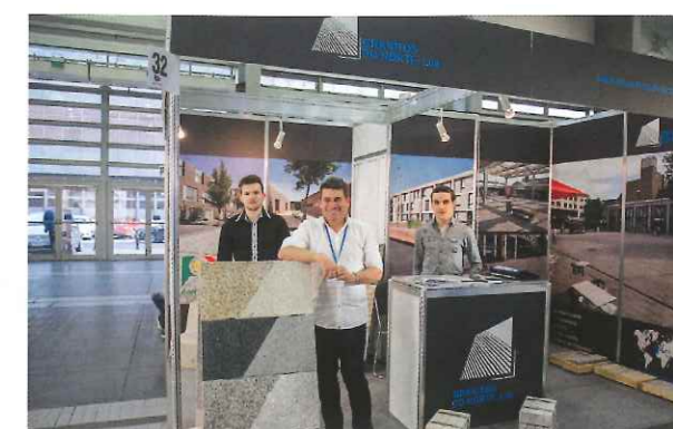
Granitos do Norte – z siedzibą w Favões – specjalizuje się w obróbce granitu pochodzącego z kopalni w Mondim de Basto. Poczyniona modernizacja sprzętowa pozwoliła zainteresować produktami kontrahentów w krajach Europy i w Stanach Zjednoczonych.