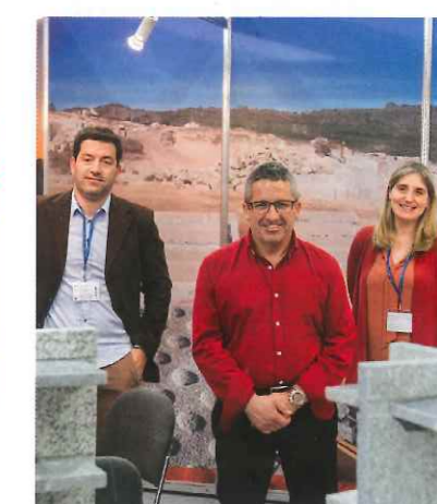
Pardais Granites – firma specjalizująca się we wszelkiego rodzaju wyrobach z kamienia naturalnego, zwłaszcza granitów szarych, ale też np. o żółtej czy lekko niebieskawej barwie, a poczynione niedawno inwestycje gwarantują dużą zdolność produkcyjną.

gospodarki i zapewnieniu dobrobytu dla obywateli”.