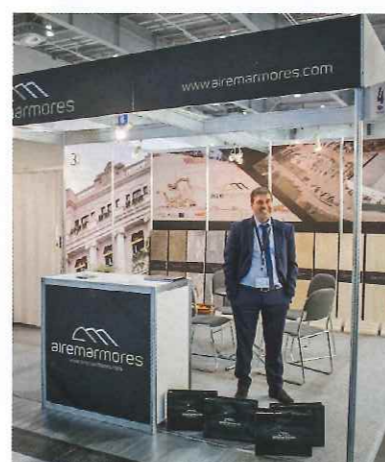
Airemármores – firma założona w 1983 roku – słynie dziś z wydobycia i obróbki portugalskich wapieni i marmurów, jest jednym z największych eksporterów tego typu materiału, zwiększając co roku udział w dostawach na rynku krajowym i międzynarodowym.