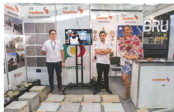
Granifinas – ok. 30% swojej produkcji eksportuje, a od chwili uzyskania w roku 2010 certyfikatu jakości na wydobywany granit cieszy się znaczącymi udziałami w realizacjach architektonicznych we Francji, Hiszpanii, ale też w Niemczech, Włoszech, Angoli i Mozambiku.