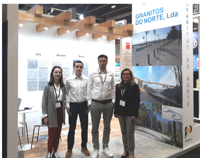
GNT—GRANITOS DO NORTE

A próxima edição da NATURAL STONE SHOW terá lugar de 27 a 29 de Abril de 2021.