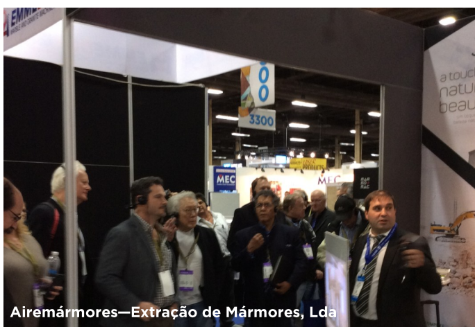
Airemármores—Extração de Mármore, Lda