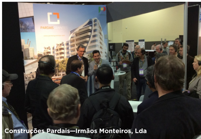
Construções Pardais—Irmãos Monteiros, Lda