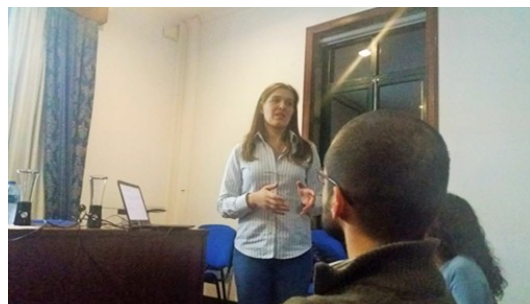
Junta de Freguesia de Alpendorada, no Marco de Canaveses