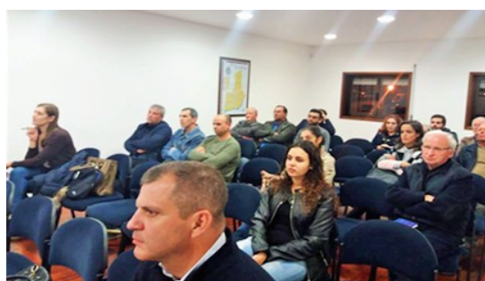
Junta de Freguesia de Rio de Moinhos, Penafiel