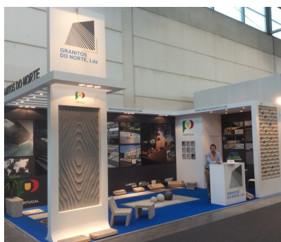
GNT—GRANITOS DO NORTE