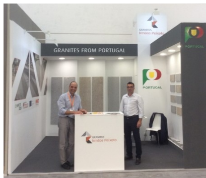
GRANITOS IRMÃOS PEIXOTO