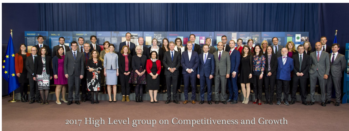
2017 High Level group on Competitiveness and Growth

Realizou-se, no passado dia 4 de maio, em Bruxelas, a Reunião do Grupo de Alto Nível da Competitividade e Crescimento, tendo a DGAE integrado a delegação portuguesa.