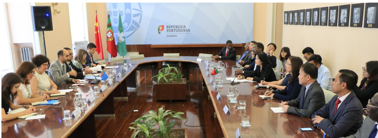
Reunião no Ministério da Economia

Uma delegação do Secretariado Permanente do Fórum de Macau, chefiada pela Secretária-Geral, Xu Yingzhen, visitou Portugal, nos dias 19 e 21 de junho, com o objetivo de promover a cooperação no âmbito da capacidade produtiva, entre a China e os Países de Língua Portuguesa (PLP).